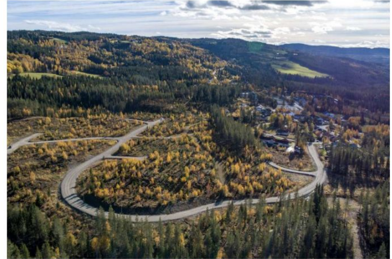
Tomtefelt som dette i Nordre Land, ligger klargjort til boligbygging, men har hittil stått stille fordi kjøpere mangler finansiering.