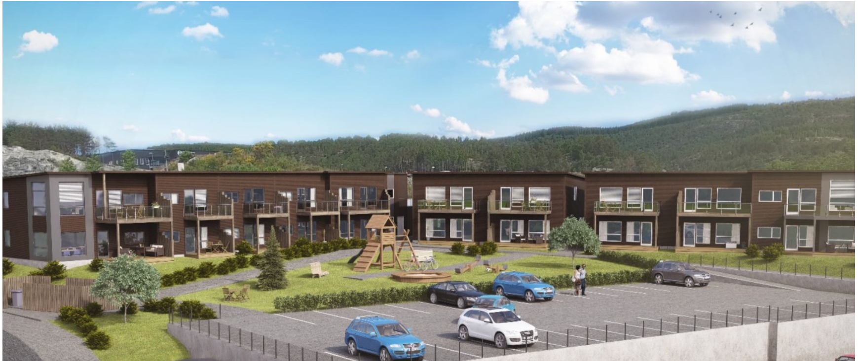
Hordasmibakken - et boligprosjekt til etterfølgelse – Veiviseren

Målgruppen er ungdom i etableringsfasen, men også andre som har vanskeligheter med å komme inn på boligmarkedet. Prosjektet er et samarbeidsprosjekt med Husbanken og Lindås kommune.